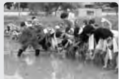
休耕田を利用して田植え体験