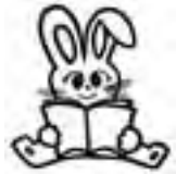
平生町生涯学習推進マスコット「マナビット」