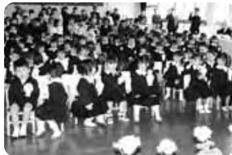
△平生幼稚園（4月11日／39人）