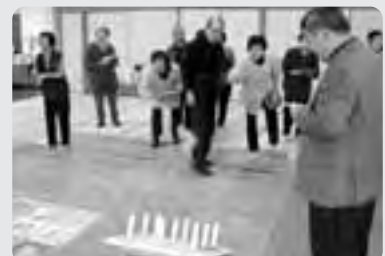
楽しいゲームで介護予防