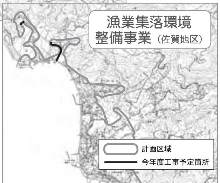
○ 計画区域 — 今年度工事予定箇所

公共下水道事業、漁業集落環境整備事業 に関するお問い合わせ 町役場 建設課 下水道班 Tel (56) 7118