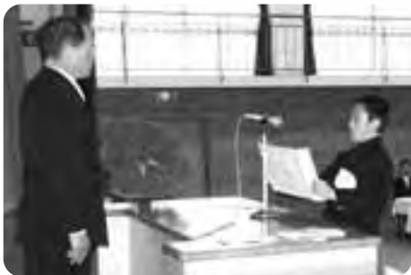
△平生中学校（4月9日／112人）