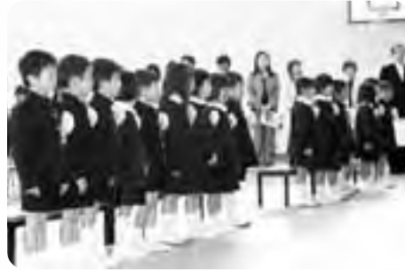
△佐賀小学校（4月9日／17人）