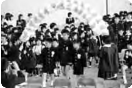
△平生小学校（4月9日／97人）