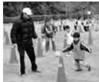
△3月11日 スポレク公園にて

また、開催にあたっては町内各幼稚園、保育園に募集要項の案内の配布をお願いして参加者を募り、その結果、各園のご協力のおかげで34名もの申し込みがあり、大変な盛り上がりを見せました。 この日行った内容としては、「しっぽ取り」「コーン倒し」「じゃんけん大会」「親子転がしドッジ」「グループづくり」「ジグザグ走りとステップワーク」や「ドリブル競争」、そして最後に子ども大好きな「ゲーム」を行い、あつという間に1時間半が過ぎていきました。 終了後、保護者の方に参加してのご意見を聞いた内容を紹介しますと、「走り回っているとき、とても楽しそうでした」「サッカーが好きなのになかなか機会が無かったので、とてもいい企画だと思えます」「知らない子どもたちもいっしょにひとつのことを楽しむ機会(身体を動かして)が少ないので、すごく良かったです」