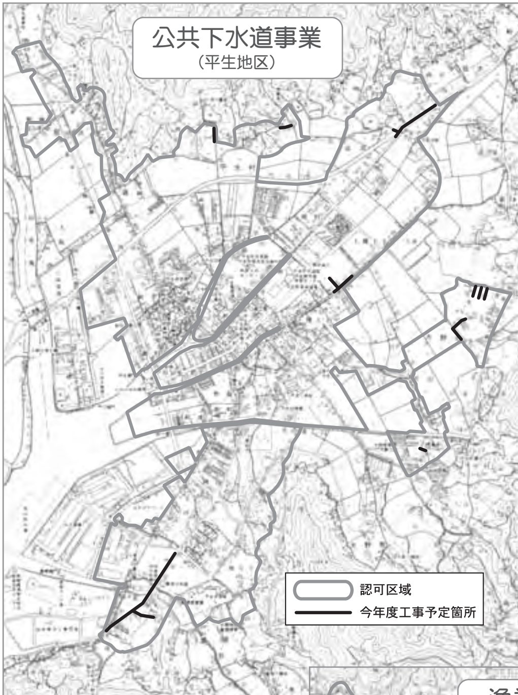
○ 認可区域 — 今年度工事予定箇所

※これら事業は、国からの補助金の額によって、実施される事業量が左右されますので、工事の区域が変更される場合もあります。