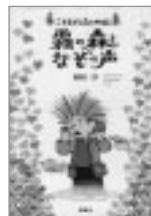
岡田 淳作(理論社) 霧の森となぞの声

本町では、一昨年「平生町子ども読書活動推進計画」を策定し、子どもの読書活動の推進を図るため児童書の整備充実に努めています。子どもにとって読書は、豊かな情操を育むとともに、人間形成の上で大きな役割を担っています。今回のご寄付で乳幼児から小学生・中学生・高校生を対象にした本を76冊購入させていただきました。図書館玄関正面にコーナーを設けておりますので、ぜひご利用ください。