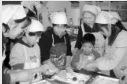
親子の料理教室 (2月14日/大野公民館)