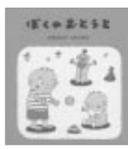
いごひるし画 童心社 ほくのおとこ