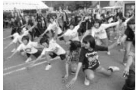
特産品センター感謝祭でヤッチャレ群団の方々と一緒によさこいを踊る子どもたち

コミュニティ・スクール推進事業は終了しますが、平生小学校はこれからも「地域の学校」コミュニティ・スクールとして、学校・家庭・地域が連働した取り組みを行っていきたいと思います。地域の皆さま、これまでの2年間のご支援・ご協力に感謝申し上げますとともに、今後も変わらぬご理解・ご協力のほど、よろしくお願いいたします。