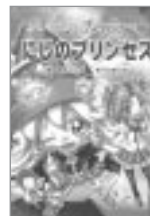
藤 真知子 作岩崎書店 にしのプリンセス チジマしよチャミーと