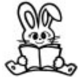
平生町生涯学習推進マスコット「マナビット」