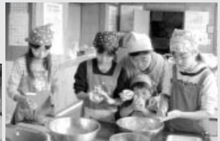
親子料理教室 (2月14日/曾根公民館)