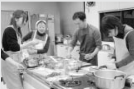
勤労青少年ホーム料理教室 (2月10日/保健センター)