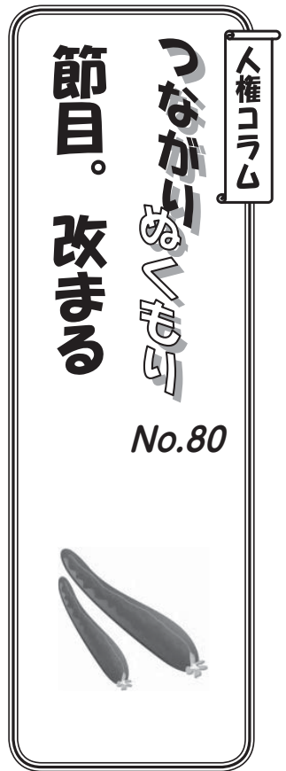
平生町人権教育推進協議会 (事務局：町教育委員会)

年齢が数え年であった頃は、元旦は特別の日でした。数え年では元旦に家族全員が一歳、歳を重ねるからです。そのため、元旦は家族全員が来し方(こしかた)にけじめをつけ、この一年間の目標を立て抱負を誓い合う節目の日でした。元旦の食卓は家族全員の心改まる誕生会の日だったのです。現在は満年齢が一般的ですが、成人式を一齐に祝うとなれば、数え歳の感覚となり、年齢の数え方にあいまいさが残っているのも確かでしょう。