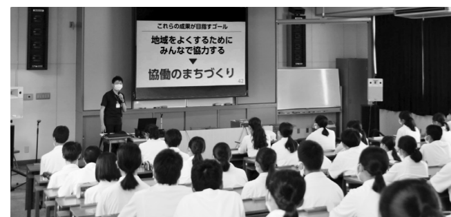
出前講座の様子（熊毛南高等学校）