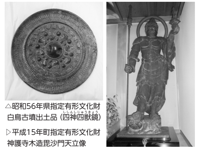
△昭和56年県指定有形文化財 白鳥古墳出土品 (四神四獣鏡) ▷平成15年町指定有形文化財 神護寺木造毘沙門天立像

平生町の貴重な文化財を後世に残すため、山口県指定文化財「白鳥古墳出土品」の金属製品と平生町指定文化財「神護寺木造毘沙門天立像」の保存修理を行いました。