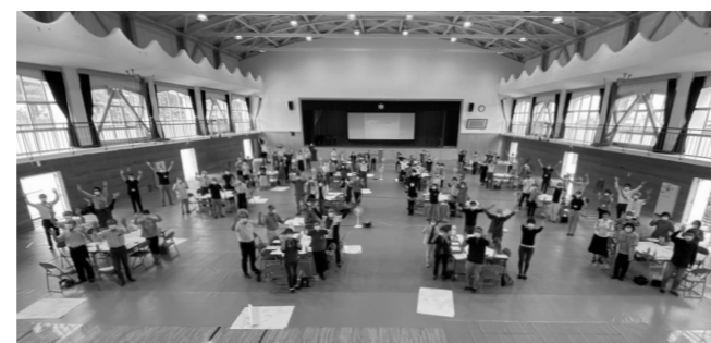
まちづくり懇談会の様子