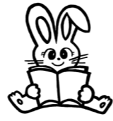
平生町生涯学習推進マスコット「マナビット」