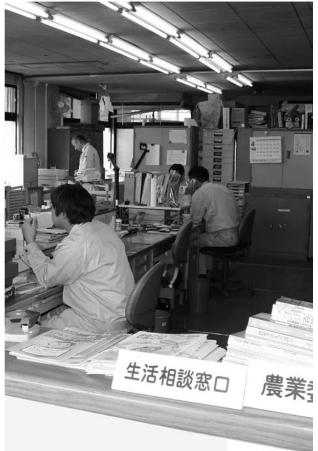
相談は経済課の窓口で

町は、被害防止へ向け、暮らしの安全安心推進員の設置や、無料の法律相談会の紹介をしている。 消費者への啓発は、町の広報及び消費者問題協議会の会報などを通じて行っているが、総合的に取り組みを進めていく必要がある。 経済課に相談窓口を設置しており、各課とも連携しながら、いろんな相談に対応していきたい。