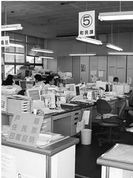
町民課がこの制度を担当