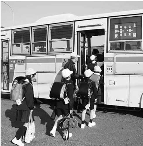
バス通学する子ども達