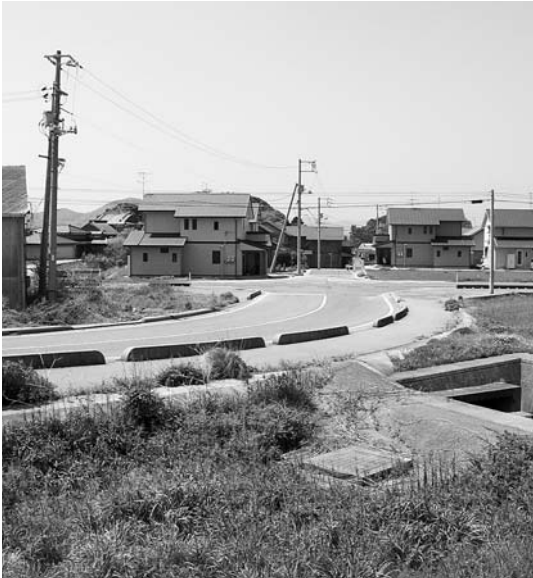
第三次総合計画で建てられた若者定住促進住宅