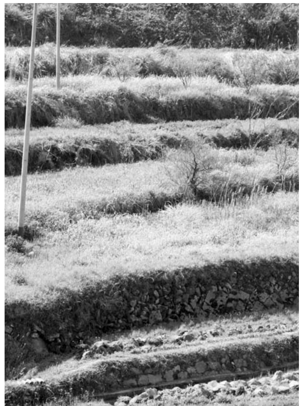
耕作されず荒れていく農地

耕作放棄地対策の一環として、鳥獣関係の対策も含めて計画の中に盛り込んで策定をしていきたい。