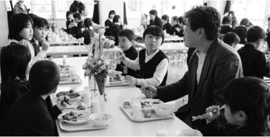
楽しい給食時間（佐賀小ランチルーム）