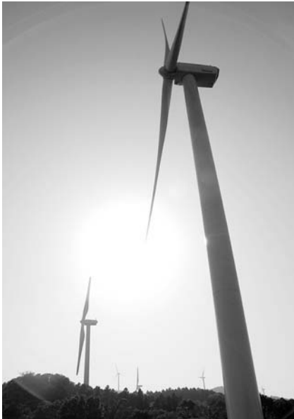
新しく建てられた風車