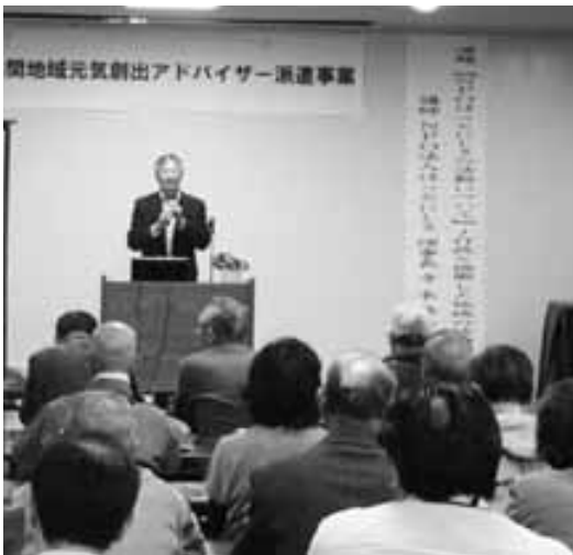
佐賀地区で行われた講演会

医療は、佐賀地区には新たに医療機関がオープン予定でもあり、全体的な医療体制について事業者と協議する。地域の荒廃は、不在地主にも連絡しているが解決できていない。農業政策との関連も総合計画で詰めていく。