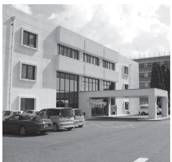
町内の介護療養病床をもつ病院