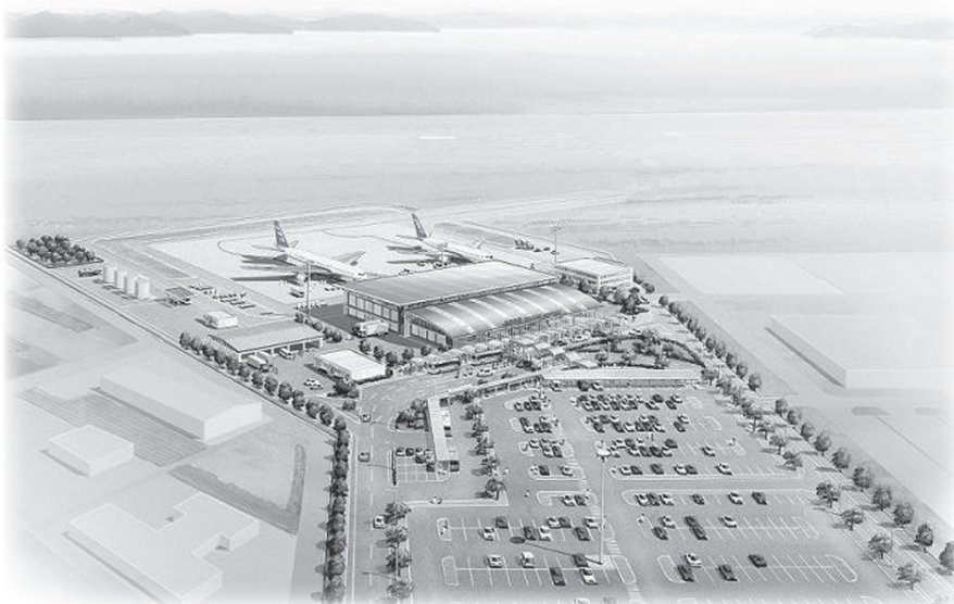
岩国空港完成予想図

答 風力発電の固定資産税の1割程度で約3000万円とし、太陽光発電の設置補助に運用する。