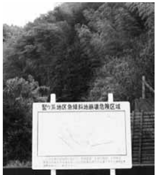
壱ヶ浜地区急傾斜地崩壊危険区域

県の指定後、警戒体制の整備を図っていく。要援護者の警戒・避難体制、町域防災計画への記載、ハザードマップによる周知、宅地取引における措置等の対策を行う。