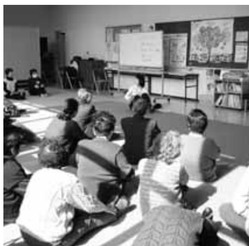
心身の健康づくり会場

質 保健センターは住民の心身の健康づくりや母子保健対策事業など重要な役割をしている。育児休業や病欠で職員が手薄な上、新規事業も多く、インフルエンザ対策事業もあり大変忙しい。対応はどうしているか。 答 育休では職員が安心して取得でき、その経験を仕事に生かせる体制になっているか。平生町社会福祉協議会や高齢福祉班と事業の重複がないか協議されているか。