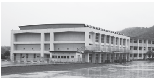
平生中学校屋内運動場