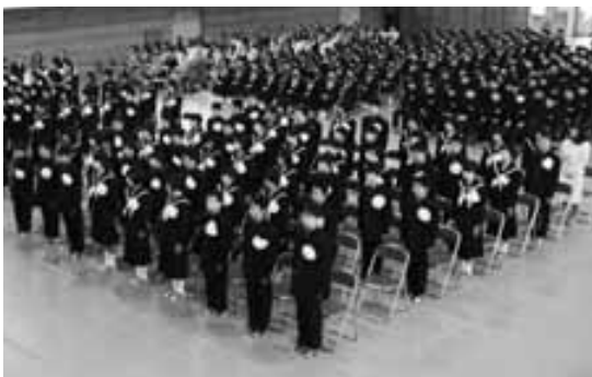
平生中学校入学式

山口県教育方針として、1学級を35人以下にするという加配教員を配置している。 町単独事業としては学校支援補助教員を配置、また英語指導教師も配置している。 このほかできる限りの学校支援を補助教員という形で設置している。 これにより、子供たちの学力向上に成果が上がっていると考えている。