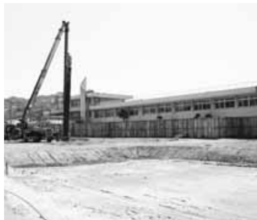
建替作業中の平生小学校

答 町長 公正な競争を促進するために、特に500万円を超える工事については予定価格及び最低制限価格とその算定基準も事前公表してきた。結果として、今回のようなくじ引きが頻発した。これは改善すべきと考える。入札制度として企業の技術力、地域への貢献度等を含めた総合評価方式による自治体も多い。これを参考にし、最低制限価格とあわせて検討する。