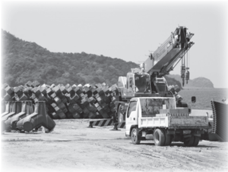
漁村再生工事現場