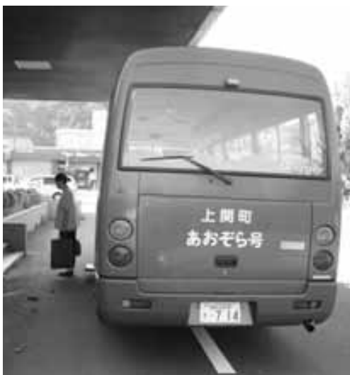
上関町の町営バス

質 町内で気持ち良く生活するには買物や行事、病院等に行く交通手段の確保が大切だ。特に高齢者のみの世帯はバスなどの公共交通手段のない周辺部は大変困っている。どのような対策が考えられているか。近隣市町では、タクシーの基本料金を補助している。平生でも考えられないか。