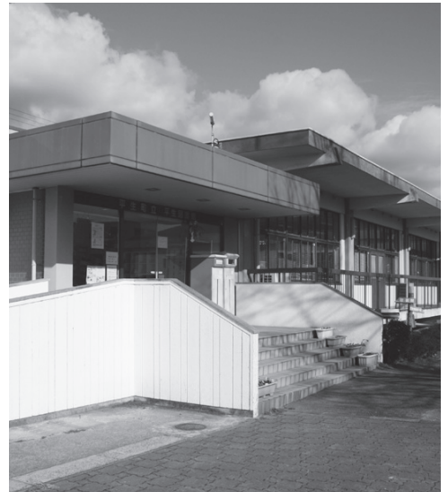
昭和42年に開設の町立図書館

蔵書数、約6万冊のうち文庫本が約600冊、新書本が約420冊で数として少ない。今後は注意をして購入していきたい。