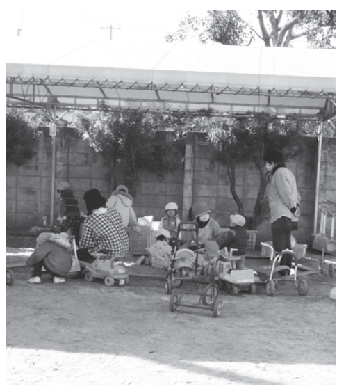
非正規職員の多い保育園

ワーキングプアとは正社員並み、あるいは正社員として働いても生活の維持さえ困難な低賃金就労者層。