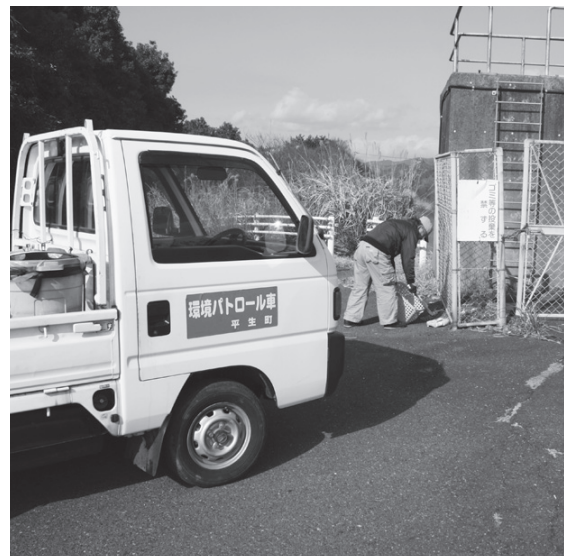
まちをきれいに（環境パトロール）

環境美化の取り組み は平成11年度から、週 1回毎週水曜日に環境 パトロールを実施して いる。 不法投棄の課題では、 県が監視員を1名委嘱 している。 一斉清掃の復活につ いては、来年度が中止 して10年になる。 一つの節目として町 民の意見を十分踏まえ て対応を考えていく。