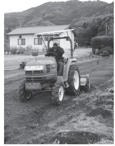
これからの農業は

政府は本年6月までにTPP参加の是非を決定するとしている。私自身は、まず日本の農業・農政を具体的