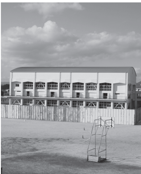
完成間近の平生中学校屋内運動場

「第四次平生町総合計画は、人口減少や少子高齢化の進行、地域主権時代への移行など、社会経済情勢の変化に対応するための視点や、まちづくりアンケートなどを行い、町民の皆様御意見を反映させた計画となっています。これから計画の実現に向けて、全力で取り組んでいきます。」 議会では、総合計画素案について、全員協議会で検討しました。