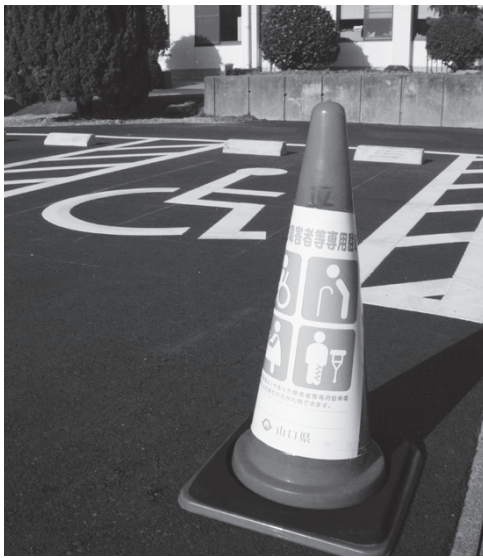
障害者等専用駐車場（中央公民館）