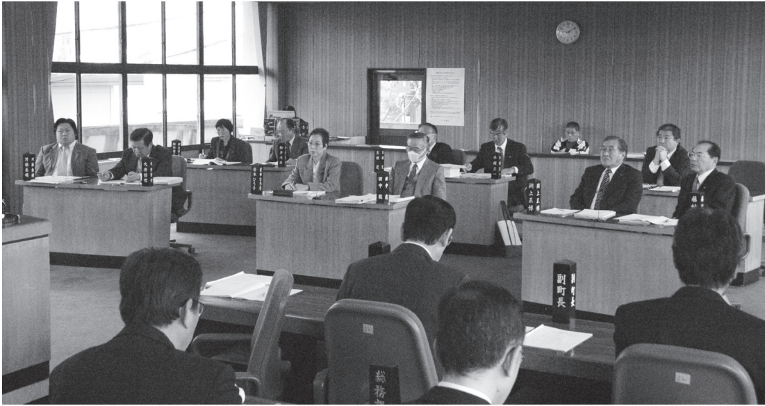
第6回定例会のようす（12月14日～21日）

第6回平生町議会定例会は、12月14日から21日までの8日間の日程で開かれました。