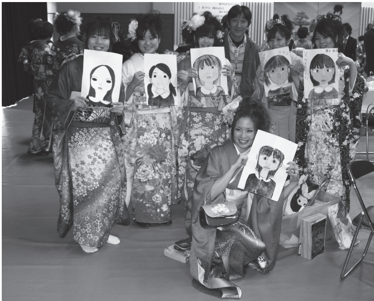
6年生の私（成人式 1月9日 平生町武道館）

発行 平生町議会 〒742-1195 山口県熊毛郡平生町大字平生町 210-1 TEL 0820-56-7110 FAX 0820-56-7109 発行責任者 福田 洋明 編集 議会広報広聴調査特別委員会