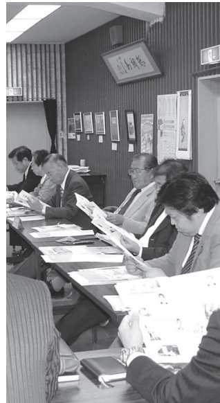
真剣に取り組む広報委員

熊毛郡広報研修会が10月8日、上関町で開かれました。第19回町村議会広報全国コンクールで最優秀賞の「いわいずみ議会だより」を参考に議 会広報の編集について学びました。次に熊毛郡3町の各議会の広報紙をもちより意見交換をしました。