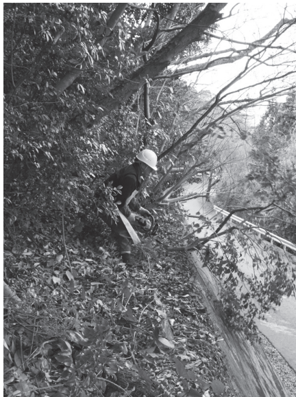
伐木による林道の管理

答 民間の事業所の整備は約6,000万円を予定されているが、国の補助基準額の上限額を交付します。