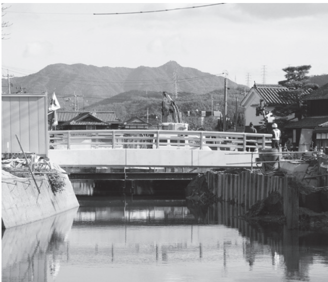
架け替えられた旭橋（大内川）