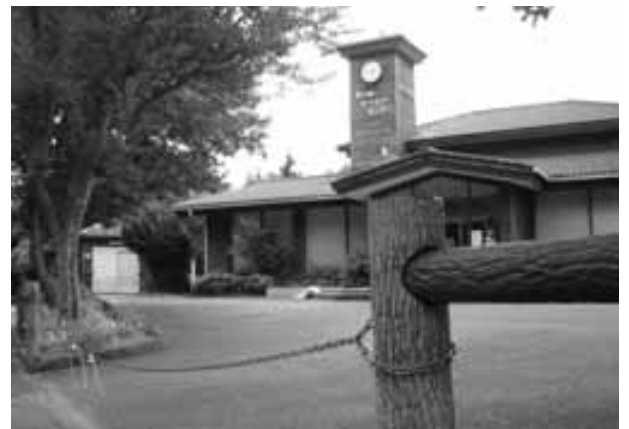
平日は使用されていないひらおハートピアセンター

質 各施設に毎年維持管理費として、厳しい町財政から予算計上しているが、各施設の有効利用及び活用を毎年話し合いをしているのか。また、検証したことがあるのか。それとも関係なく施設の維持管理のみを予算計上をしているのか。 宇佐木保育園跡地・スポレク公園・ひらおハートピアセンター等の施設を有効利用及び活用を目的として幅広く町民から意見を聞く考えはないのか。