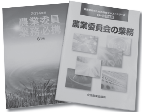
農業委員業務必携

町長 農業委員会等に関する法律の改正の基本的な方向として、公選制の廃止、市町村長の選任制への移行、農業委員定数の削減等の制度設計に着手されている。農業委員会の果たす役割、建議等を含めてい