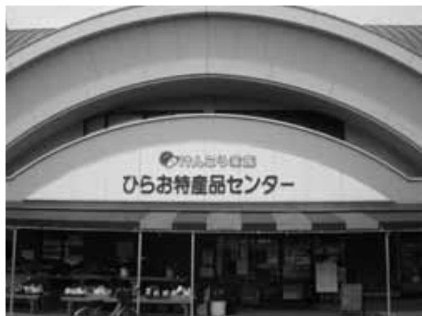
ブランド化の核となる施設