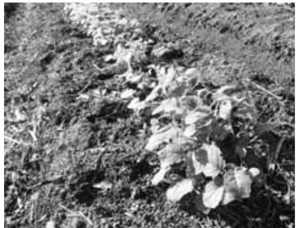
元気に育つ菜の花

最近、農業新聞を見ると耕作放棄地解消運動の特集には油作物で耕作放棄地を解消したとの記事が目につく。大分県豊後高田市ではヒマワリ・コスモス・菜の花・そば・オリブを作付けし、ヒマワリと菜の花から油をとり販売している。地域住民全員参加型で花いっぱい運動から始めゆくゆくは油を搾るプロジェクトを計画してみてはどうか。