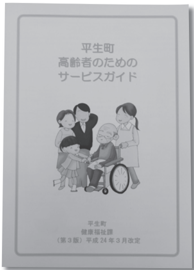
平生町高齢者のためのサービスガイド