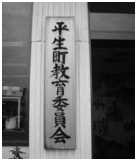
平生町教育行政の中核