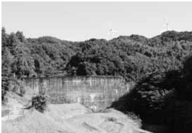
大野神領の砂防ダム