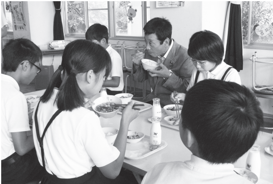
児童と一緒に給食をとる、ありし日の久保議員 (平成27年7月6日 佐賀小の複式学級視察)