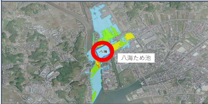
【雨量・河川水位等情報】