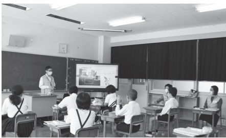
▲昨年度の行政相談出前教室の様子