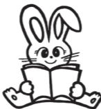
平生町生涯学習推進マスコット「マナビット」