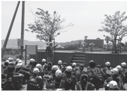
▲熊毛南高等学校1年生