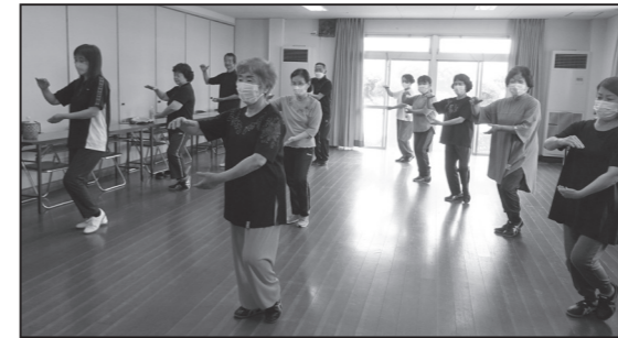
太極拳教室の様子（大野地域交流センター）▲