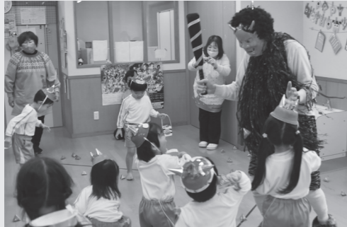
ひらお保育園（2月1日）