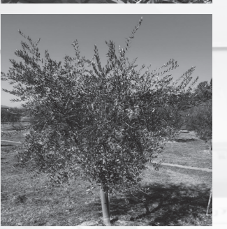
オリーブの木を剪定している様子（上） 剪定後のオリーブの木（下）