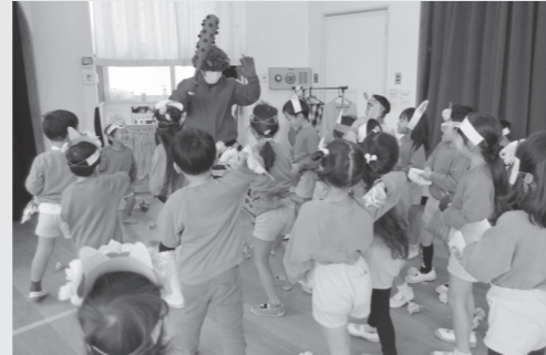
つばさ保育園（2月2日）