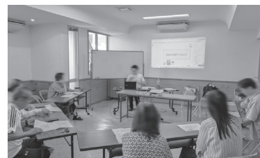
スマホ教室の様子