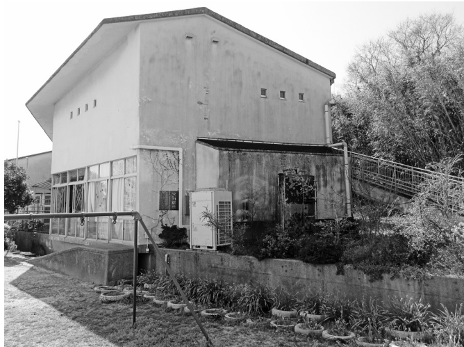
老朽化が進んでいる佐賀保育園

質 二、三年したら佐賀保育園はなくなるのか。さらに、その内には佐賀小学校さえなくなるのか。そんな不安が佐賀地区で囁かれている。 佐賀の不安を一掃する必要はある。佐賀保育園の今後について園児の予測数、体制などについて、どう考えているのか。