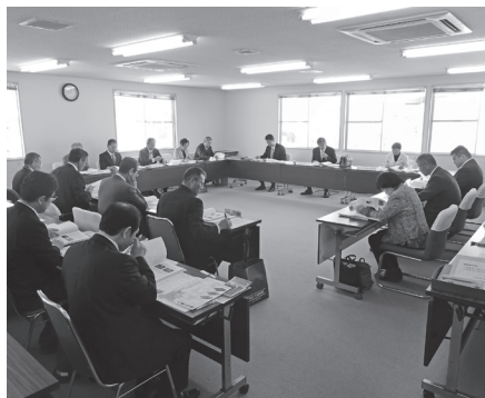
協議している特別委員会（4月10日）

答 4月13日から5月 14日までの期間で、基 本計画に関するパブ リックコメントを实 施。ホームページに も掲載し、意見を募 集する。意見は今後 の基本設計に反映さ せていく。住民説明 会の予定は、計画の 概要版を資料として 連休明けに実施する ことで調整している。