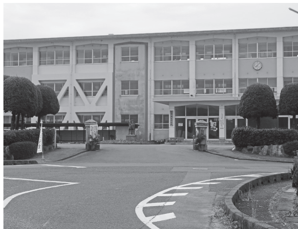
部活が活発な平生中学校

中学校部活動については、毎週水曜日を部活動の休養日としている。学校教育法施行規則が改正され、部活動の指導技術や大会等の引率を行うことを職務とする部活指導員の制度化が新たに規定された。モデル地区として宇部市と美祢市が部活動指導員を配置しており、その成果や課題について情報収集し、学校の意見も尊重し、支援のあり方について検討する。