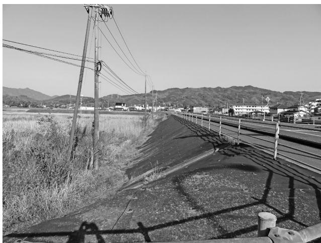
国道188号線沿いの近隣商業地域