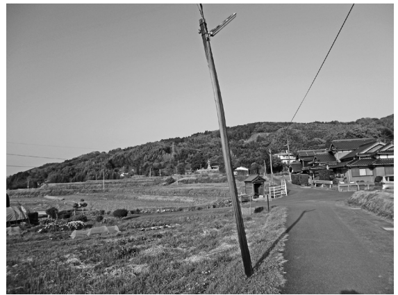
倒れかけた木製電柱

質 木製電柱の撤去、建て替えを推進する助成制度の創設はできないか。町の考えを問う。 道路に接して立つ木製電柱については、災害時の避難経路の安全確保策として撤去、建て替えを推進する必要があると考える。 限られた財源ではあるが、減災への取り組みは優先課題と判断する。