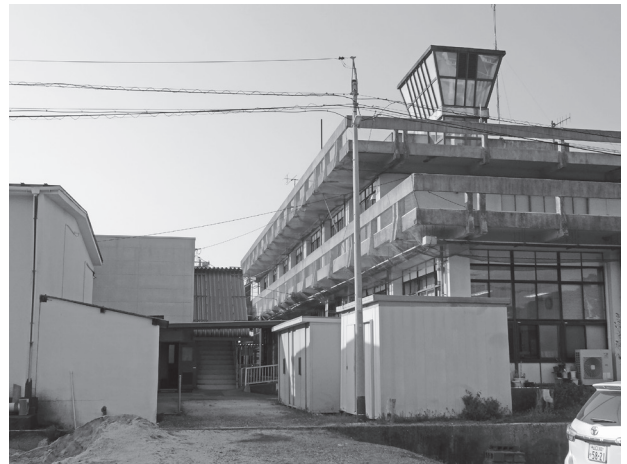
建て替えが協議されている庁舎

東日本大震災、熊本地震で庁舎が崩壊し行政業務がとどこおった。国は、庁舎建設に対し22.5パーセントの交付税措置を行っています。当町の庁舎は1960年（昭和35年）に建設されて、耐震に対して「ゼロ」となっており、当町においてもこの交付税措置を使うとして、新庁舎を建設する方向に進むことになりました。しかし、町議会は、新庁舎建設に対して建設費用が膨大になるため、庁舎建設を執行部主任にするのではなく、私