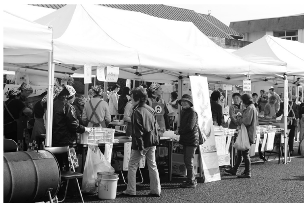
多くの皆さんが参加した産業まつり

今の平生町は昔のような循環型の構造ではない。地場で頑張っている企業や商店に対する支援をしっかりと、そこで雇用等に反映をしていけるよう取り組みを進めなくてはならない。 地方創生に金融機関もいるんな立場で協力していただいている。起業チャレンジ補助金事業についてもしっかり連携をとっている。