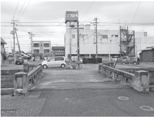
改修が計画されている共栄橋

国民健康保険事業繰入金が前年度に対し1,840万5千円減少。被保険者一人あたり保険税が5千円程度安くてできる額。保険税が高いという町民の声に傾聴し、少しでも安くするべき。一般会計についても同様の理由から反対。