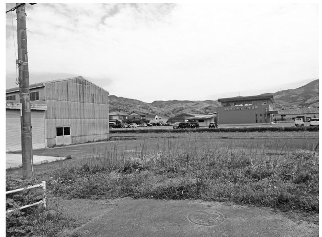
農協倉庫の裏を計画している街路中央線