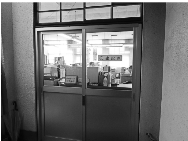
派遣職員がつとめていた建設課

派遣は今回が初めてである。契約期間は年度末となっている。再雇用については、臨時職員で対応する。その他の質問 風力発電について