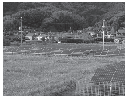
いたる所に見られる太陽光発電施設

平成24年から令和2年5月までの期間で、388件、約45.2ヘクタールの農地が転用され、太陽光発電施設が設置された。今後は、令和2年3月に環境省において制定された「太陽発電の環境配慮ガイドライン」に沿って事業を進めていくように事業者に指導し、条例制定については、全国の関係条例の内容を確認し、検討したい。