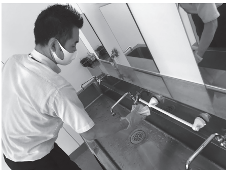
学校における消毒作業の様子

文部科学省作成の「学校における新型コロナウイルス感染症に 関する衛生管理マニュアル」をはじめとする様々な文書を、各学校で作成している「感染症対応計画」に反映し、実践している。学校の取り組み等は、保護者に丁寧 に 説明し、情報交換、情報共有に努める。