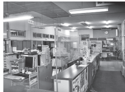
各課窓口につけられたビニールシート

質 緊急事態宣言は、解除され、新たな感染者の増加も少なくなっているが、感染拡大の防止は、引き続き重要な課題だといえる。 答 町長 医療機関への支援に除かれ、新たな感染者の増加も少なくなっているが、感染拡大の防止は、引き続き重要な課題だといえる。 ①感染拡大防止については、何よりも医療体制の強化と改善が求められてきたが、平生町としては医療機関への支援はどうなっているのか。 ②PCR検査体制、保健所機能などが諸外国に比べて貧弱であることが明らかになったが、PCR検査体制の現状はどうなっているのか。 医療機関への支援については、国や県による支援が行われているが、本町独自の支援は実施していない。今後の二次補正予算の成立を待って、本町で取り組める事業があれば、積極的に活用していく。PCR検査等の体制については、県において「地域外来検査センター」の設置が検討されており、今後の第二波、第三波に備える意味で、本町でも近隣市町や関係医師会と協議・検討を進める。