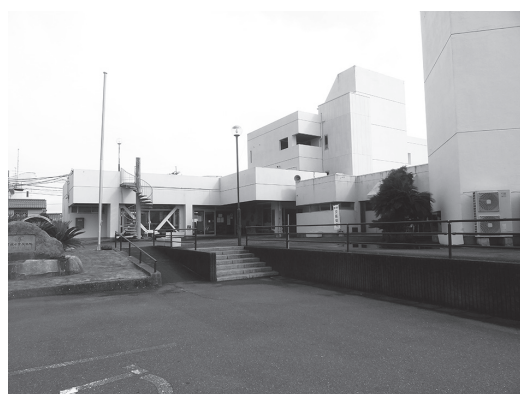
平生まち・むら地域交流センター

より効果的な協働の形態として有効である場合は体制の整った協議会においては指定管理の協定を締結したい。