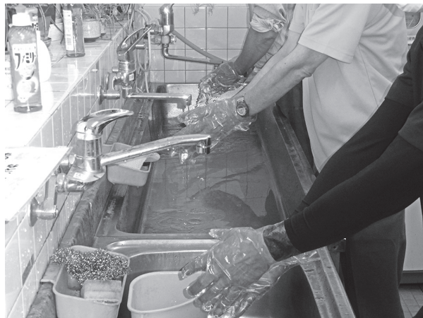
新しい生活様式プラスビニール手袋

大規模災害時、手洗いができないような状況の時に必要なので備蓄しておきたい。ビニール手袋などの使い捨て手袋は、使用后、すぐに廃棄するのが一般的である。また、長時間着用すれば破損の恐れもあり、常時着用するものではないと認識している。小まめな手洗いがなよりの感染症防止ではないかと考えている。