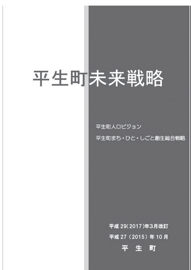
平生町未来戦略 (平生町まち・ひと・しごと創生総合戦略)