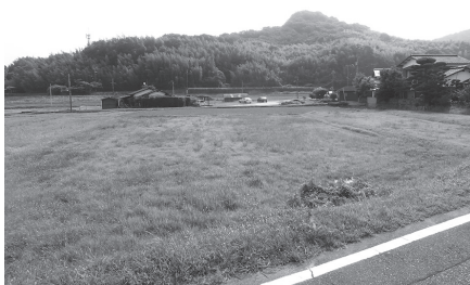
柳井・平生バイパス予定地