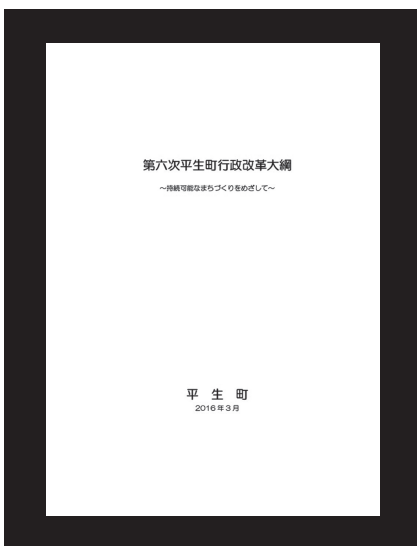
第六次平生町行政改革大綱

大綱の内容は、現在、昨年度の実施計画の進捗を取りまとめている段階。現在の状況と照らし合わせ修正し、近年の取り組みべき課題や本町における課題を盛り込んでいくことを想定している。