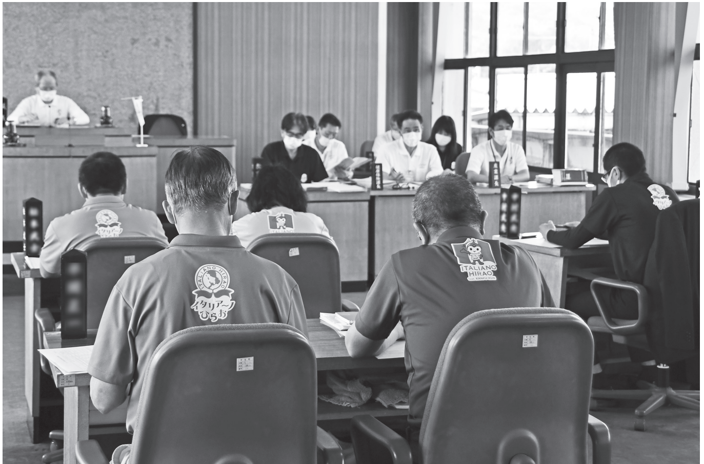
イタリア～ノひらおポロシャツを着用した定例会