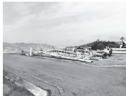
田名ふ頭にある大島大橋鋼材

公害を未然防止することが重要であり、公害が発生しないように関係機関と協議を重ね、情報交換を行いながら住民の健康で文化的な生活を守っていききたい。大島大橋の鋼材については鋼材の売り払いを県が予定しているのので事業者が決まり次第撤去していく。