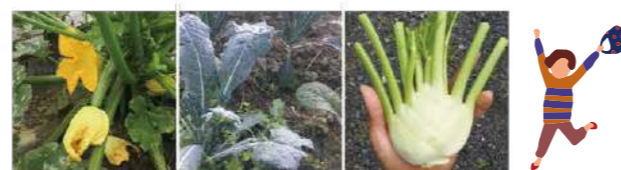
季節により、販売内容が異なります。

町内では、ズッキーニやフェンネルなどのイタリア野菜の栽培も行われています。栽培された野菜は、ひらお特産品センターで販売しています。