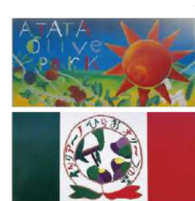
平生中学校総合文化部のみなさん作成の看板